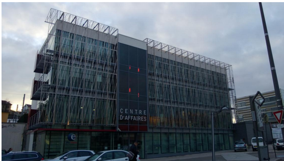
CCI des Vosges / Agence Klaus Architecte